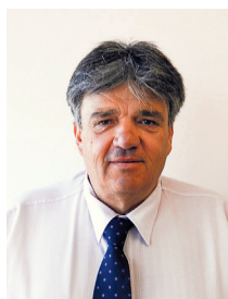
Por Ulises Forte Presidente del IPCVA

Hoy tenemos, gracias al trabajo del sector público y del privado, un gran menú de opciones para colocar nuestros productos: Unión Europea, China, Israel, Chile, Rusia, Estados Unidos y Japón (para la Patagonia), entre otros. Y vamos por más: Corea del sur, México y países del Caribe, Japón para el resto del país y otros países del sudeste asiático. Por otra parte, sabemos que el mercado interno, alicaído en los últimos tiempos, se va a recomponer cuando se recupere un poco la economía, ya que la gente bajó el consumo por “billetera flaca”