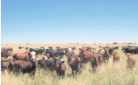
Bienestar animal: modelo argentino

Está bajo discusión si debe además tener espacio para darse vuelta, tema arduo porque duplicaría la superficie necesaria por animal. Si se comparan estas pautas con las condiciones de vida del ganado en la Argentina, es obvio que nuestros sistemas de producción tienen ventajas notorias en materia de bienestar animal. En particular, nuestra ganadería extensiva y campo abierto permite al vacuno vivir una vida más acorde con su naturaleza, y "manifestar su comportamiento normal" (5ª. Libertad). De ahí que el bienestar animal, bien entendido, puede convertirse en una ventaja competitiva para nuestras carnes vacunas.