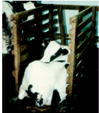
Espacio aceptable en la Unión Europea para el bienestar animal