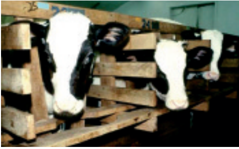
Bienestar animal: modelo europeo