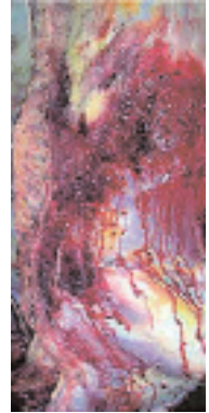
Carcasa arruinada por el pisoteo