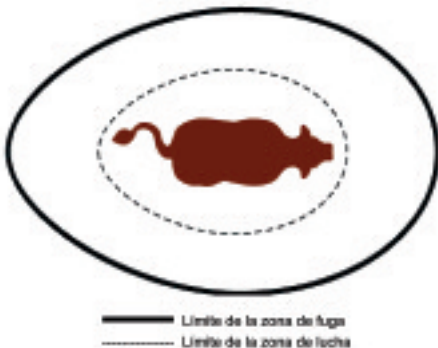
Figura 1: Zonas de fuga y de lucha del bovino

Resulta fácil mover a los animales si se trabaja desde el borde de la zona de fuga. La persona debe ubicarse lo suficientemente cerca del animal como para hacerlo caminar, pero no tan cerca como para provocarle pánico y hacer que huya o que se le enfrente. Si la persona se acerca demasiado, penetrará en una segunda zona, más pequeña, que es la zona de lucha. En ese caso, en vez de fugarse los bovinos tienden a virar y ponerse de frente, manteniendo una distancia segura o enfrentando al intruso, según el