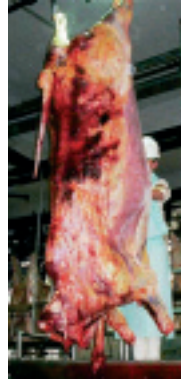
Carcasa de un animal caído

Para no sufrir pérdidas originadas en las distintas formas de maltrato. Estas pérdidas son notorias cuando los animales llegan a las plantas de faena: machucos, cortes de carne oscura, carcasas arruinadas por el pisoteo durante el transporte, etc.