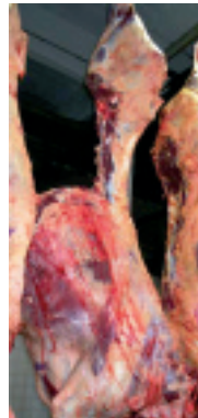
Recortes del vacío dañado por golpes en mangas, rampas o puertas