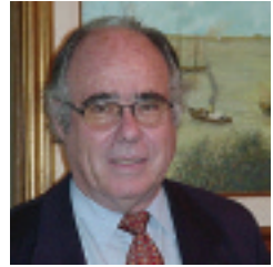
Por Arturo Llavallol Presidente del IPCVA