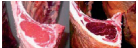
Carnes sana y carne oscura